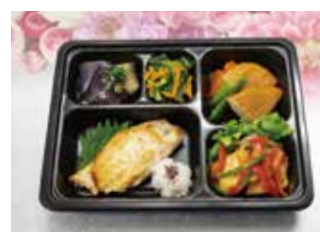
おうちに届くお弁当の一例