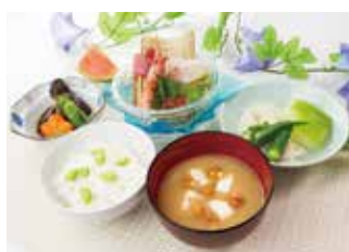
野菜を中心とした食事（イベント食の一例）

地産地消をモットーに、真心こめてお作りしたお食事をご提供いたします。毎日の「食事」だからこそ、お楽しみいただけるよう、ご利用者様の嗜好に合わせたメニュー作りを心掛けています。管理栄養士の指導による栄養管理はもちろんですが、お体の状態に合わせた食形態もご用意しておりますので、ご自分のペースでお召し上がりいただけます。また、季節のイベントでは四季折々の旬な食材を使用し、見た目にも美味しいメニューをご提供いたします。